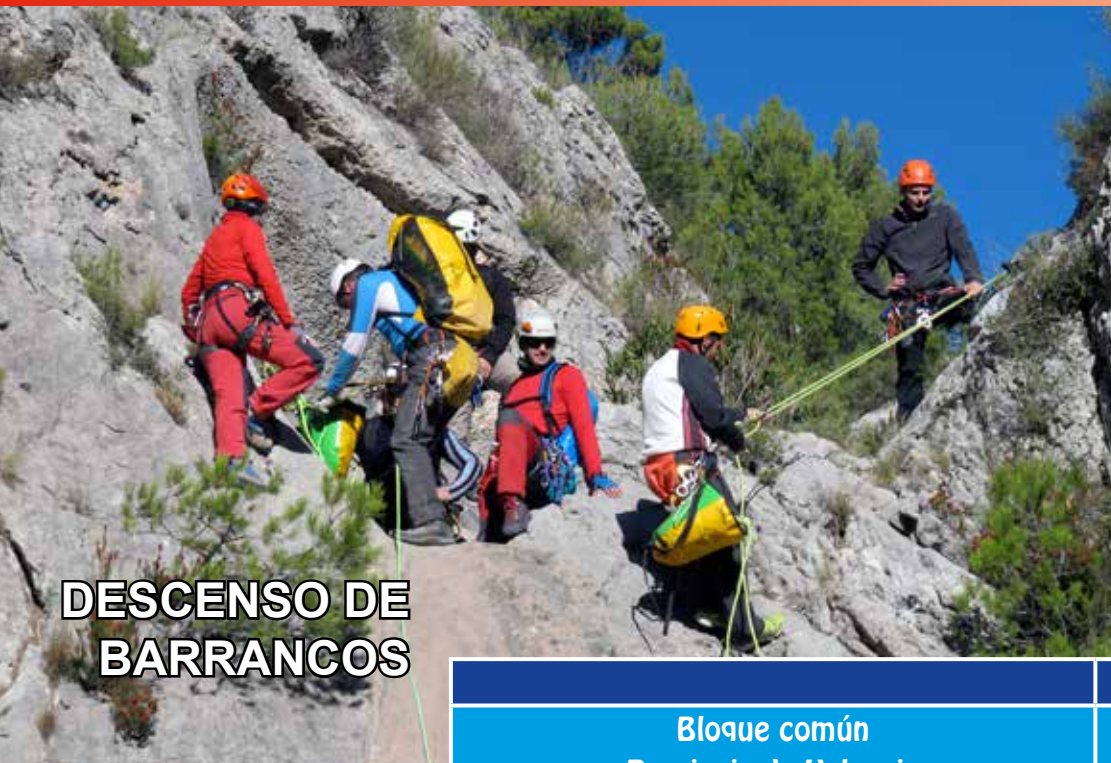
DESCENSO DE BARRANCOS